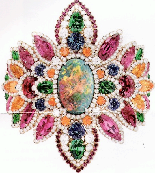
Bague Dentelle Opale d'Orient en platine, or jaune, diamants, opale noire, grenats, rubis, spinelles et tanzanites. DIOR, STAND S17