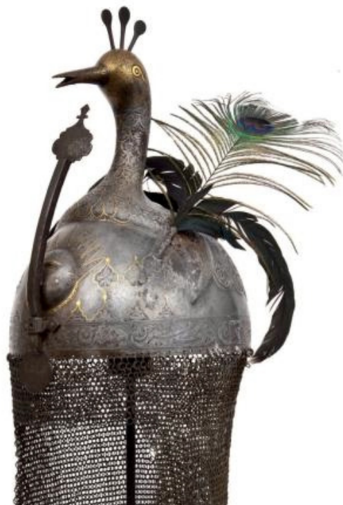
Kulah-khud zoomorphe, Iran, XIX e siècle, époque Qadjar, 32 x 19,5 cm. Estimé 4 000-6 000 euros.